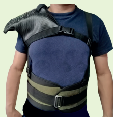
Ref: D05-01PG0001 HOMBRERAS PARA DESCARGUE DE PERFILES