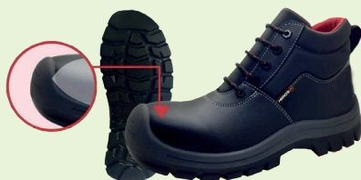
Ref: D14-02PG0004 BOTA CON PUNTERA CUERO