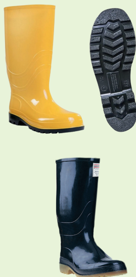
Ref: D14-03PG0002 BOTA PVC LARGA SENCILLA CON O SIN PUNTERA