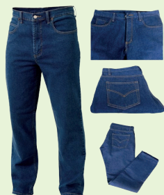
Ref: D11-04P'G0001 PANTALÓN JEANS HOMBRE