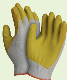
Rfe: D06-05PG0002 GUANTE HILAZA TEJIDO LATEX