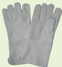
Ref: D06-01PG0002 GUANTE CARNAZA REF CARNAZA LARGO 14 CMS