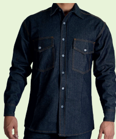
Ref: D07-01PG0001 CAMISA MANGA LARGA EN JEANS 12 OZ