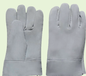
Ref: D06-01PG0004 GUANTE CARNAZA REF CORTO 7 CM